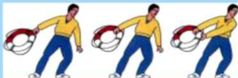
Способы подачи спасательного круга

В ледяной воде люди не могут находиться долго, поэтому жизнь и здоровье пострадавшего зависят от смекалки и быстроты действий. Поистине справедливо: кто скоро помог, тот дважды помог.